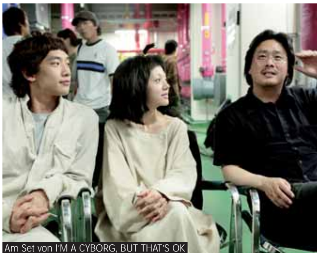
Am Set von I'M A CYBORG, BUT THAT'S OK

Seine schwermütigen, moralisch ambivalenten Charakterstudien ließ Park in seinem bezaubernd-surrealen Liebesfilm I'M A CYBORG, BUT THAT'S OK hinter sich, um dem Zuschauer auch mal eine leichtere, aber nicht minder originelle Seite von sich zu präsentieren. Der Genrewechsel lohnte sich für Park, denn seine knallbunte Psychiatrie-Komödie mit Popstar Rain in einer Hauptrolle wurde auf der Berlinale 2007 gleich mit dem Alfred Bauer Preis ausgezeichnet. Mit seinem jüngsten Glanzstück THIRST geht es bei Park wieder härter, aber nicht weniger bewegend zur Sache. Die unheilvolle Liebe eines Vampir-Priesters zu einer in ihrer grauenhaften Zwangshee gefangenen jungen Frau konnte in Cannes den Jurypreis abräumen.